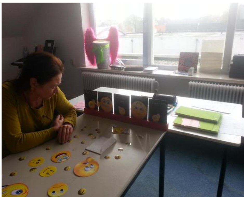
Samenwerking gestalte geven